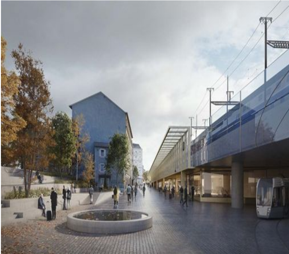
Concours, place Montbrillant